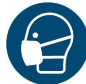
leichten Atemschutz benutzen