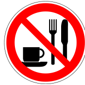
Essen und Trinken verboten