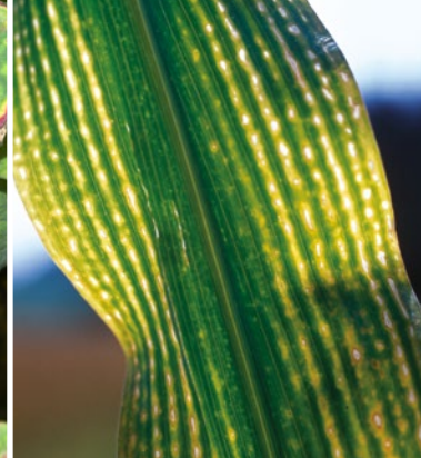
Deficiência de magnésio na colza. Deficiência de magnésio no milho.