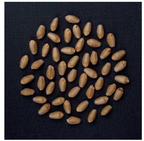
Optimale Magnesiumversorgung mit ESTA-Kieserit-Düngung.