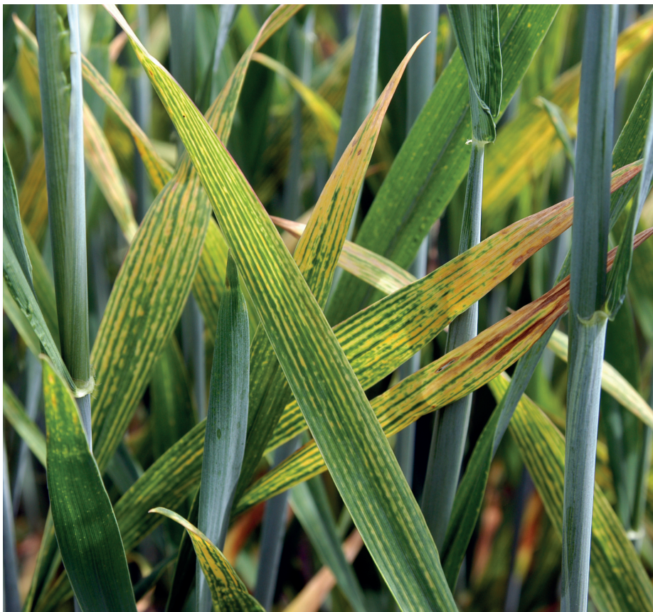
Magnesiummangel bei Getreide: An den älteren Blättern bilden sich perlschnurartige Marmorierungen bei sonst noch grünen Blattspreiten. Bei anhaltendem Magnesiummangel verlieren die Blätter ihre grüne Farbe, an den Blatträndern machen sich streifig-fleckige Vergilbungen bemerkbar.