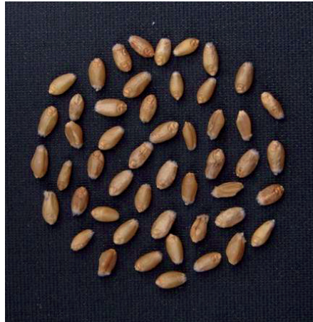
Magnesiumunterversorgung, aber späte Mg-Blattdüngung mit EPSO Top.